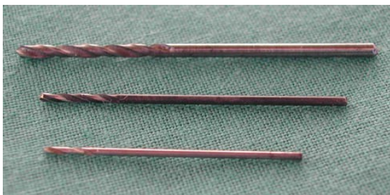
Abb. 1: HSS-Bohrer (Werkzeugstahl)