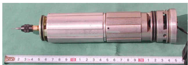
Abb. 4: Eine primitive Bohrmaschine aus einer alten Flugzeug-Benzinpumpe

Der Körper der Maschine muß eine Mindestlänge haben, weil sonst beim Bohren die richtige Stellung der Hand nicht zu erreichen ist. Der Schwerpunkt der Maschine soll so tief wie möglich liegen, damit sie die vertikale Position durch die Schwerkraft von selbst einnimmt.