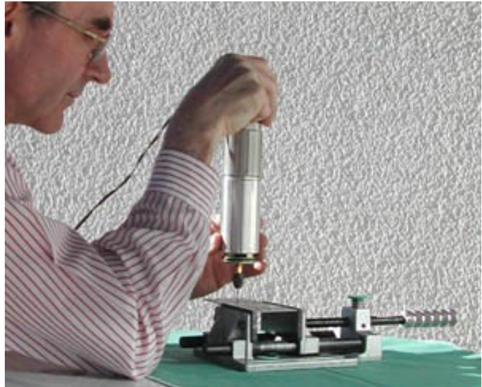
Abb. 5: So kann man die Bohrmaschine am besten führen

Es reicht ein Hub von wenigen Millimetern, um ein Loch nach dem anderen zu bohren. Während des Bohrvorganges ist jede seitliche Krafteinwirkung zu vermeiden.