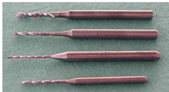
Abb. 2: Hartmetallbohrer